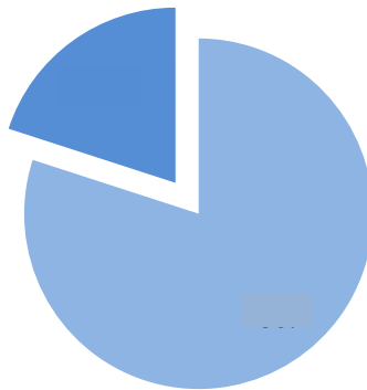
Рисунок 2.1. Специализация компаний event-индустрии