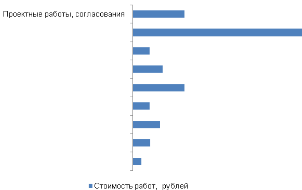
График 1. Структура инвестиционных затрат проекта