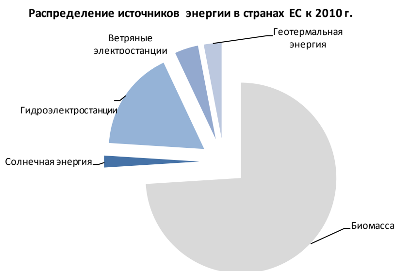
Рисунок 2. Распределение источников энергии в странах ЕС к 2010 г.

..... Перспективы использования альтернативных источников энергии (см. рисунок 2) свидетельствуют, что к 2010 году объем потребления биомассы составит XXX % от общего потребления.