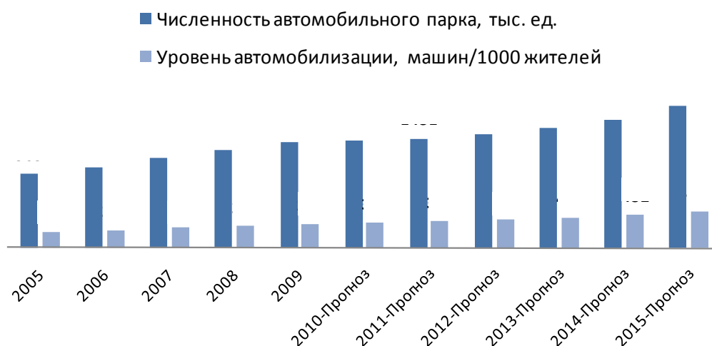
Рисунок 7. Прогноз развития уровня автомобилизации Санкт-Петербурга

По инициативе Правительства Санкт-Петербурга в ближайшем будущем количество паркингов будет увеличиваться и достигнет XXX% от общего числа мест хранения автотранспорта.