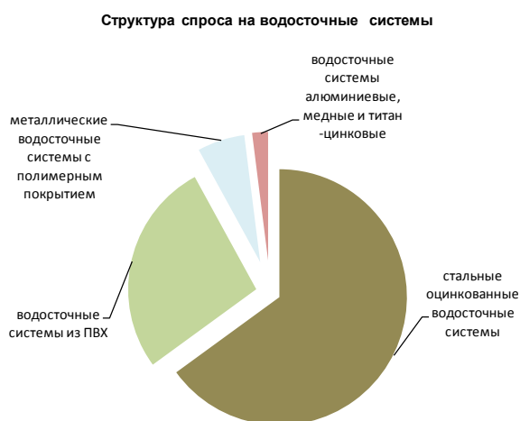
Рисунок 3. Структура спроса на водосточные системы